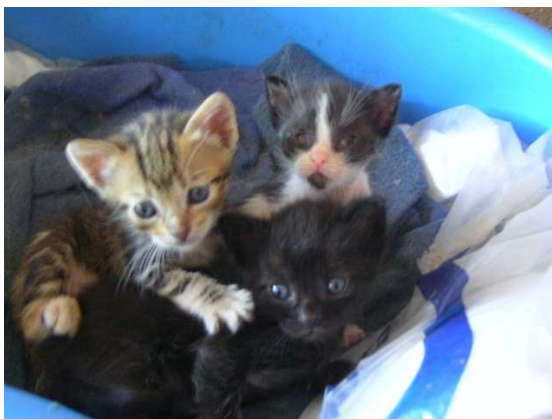
baby NeelSole, baby Angel, baby Amore

Cr.-e per questo si moltiplicano molto e spesso..